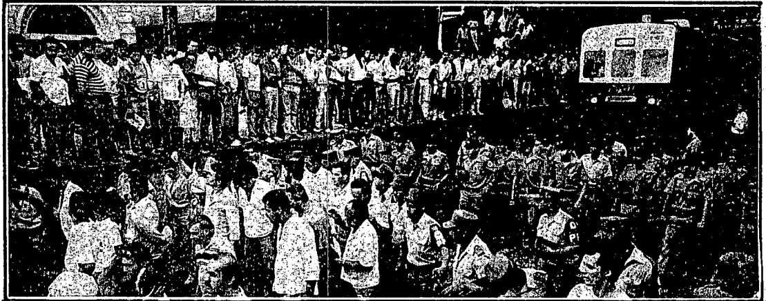
Ferrovários de São Paulo são retirados dos trilhos por policiais na Estação da Luz, quando tentavam parar os trens