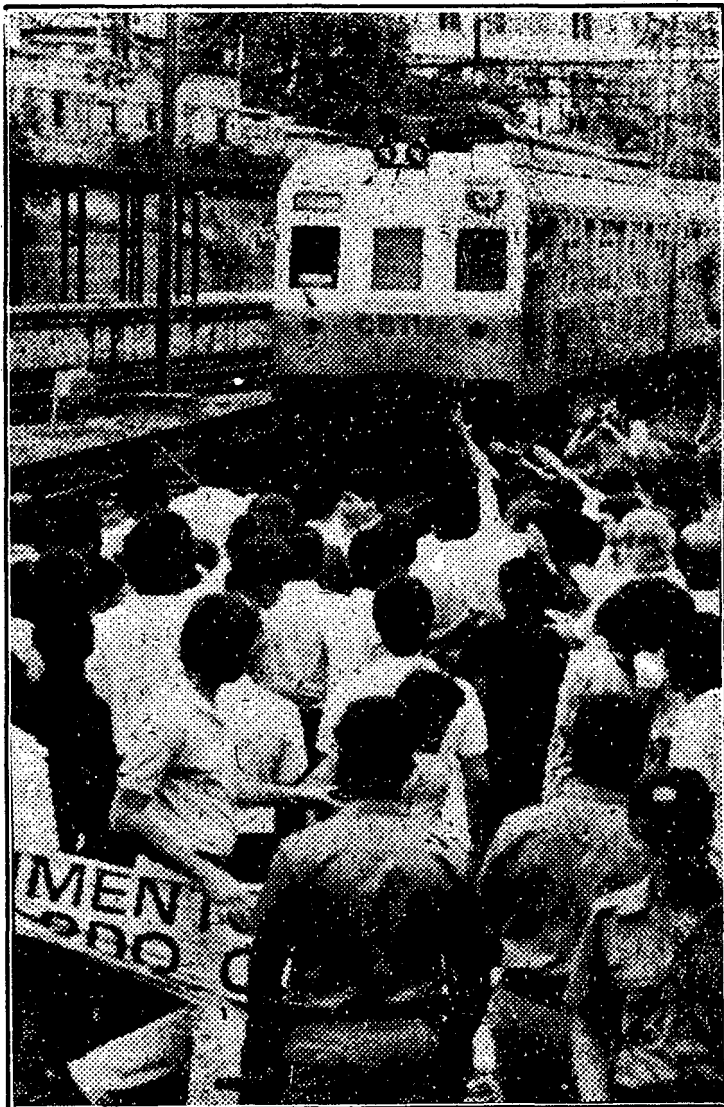
Piqueteiros invadiram a Estação da Luz (SP) e tentaram parar as composições

A Constituinte continua lenta. Durante a semana apenas 8 artigos foram votados.