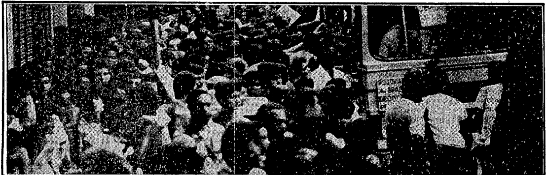
Largo de São Francisco, 18 h: pacientemente, o carioca aguardou seu lugar no Anibus para voltar para casa