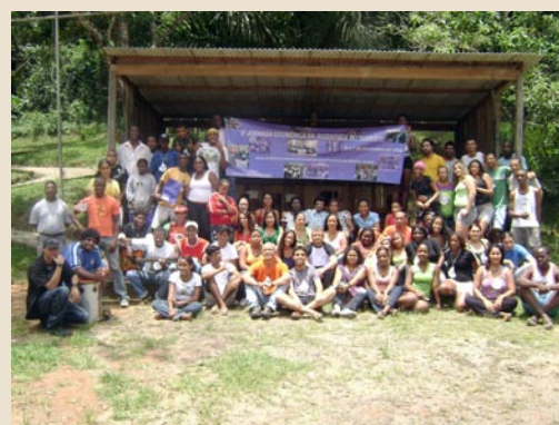
2ª Jornada do Sudeste