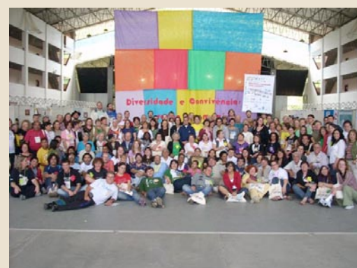
Jornada Ecumênica Sul