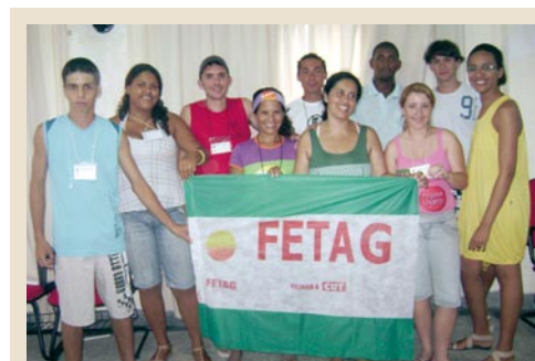
Comissão Estadual de Jovens Rurais Fluminense.

ram eleitos 37 coordenadoras e coordenadores nas cinco regiões e 10 coordenadores, como citado. Os encontros se constituíram espaços de discussão, de reconhecimento de novos atores políticos e de formação política e cidadã da juventude.