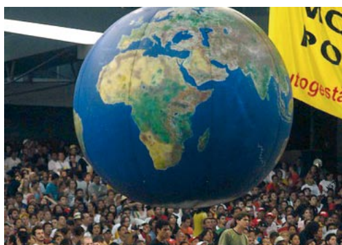
Fórum Social Mundial. Belém (PA), janeiro de 2009

Entre os dias 27 de janeiro e 1 de fevereiro de 2009 aconteceu o Fórum Social Mundial (FSM), na cidade de Belém (PA). Eram aproximadamente 100 mil participantes, vindos de todo o Brasil e de diversas partes do mundo. O evento propôs a discussão de questões sobre a construção de um mundo mais justo e igualitário para todas e todos, firmando mais uma vez, sua preferência pelos pobres. Vou descrever como foi chegar a esta cidade tão, tão... distante de onde moramos, sendo nós: gaúchos! A excursão saiu de Santa Maria, no coração do Rio Grande do Sul, sob a organização da Economia Solidária. Éramos 43 pessoas no início e mais três se juntaram a nós em Goiânia.