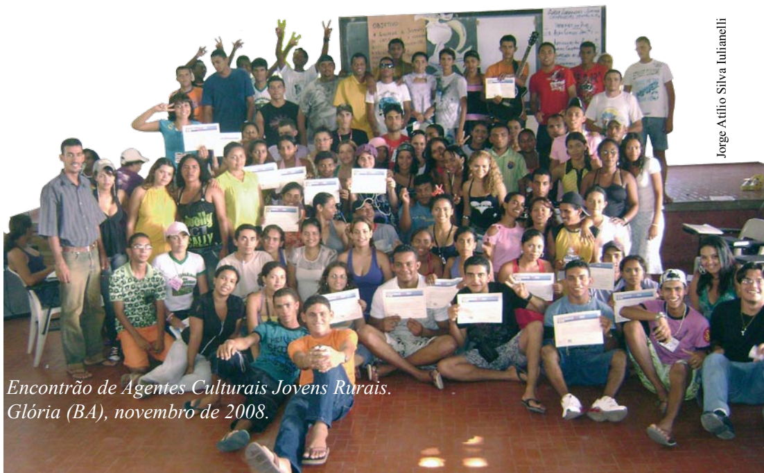
Encontro de Agentes Culturais Jovens Rurais. Glória (BA), novembro de 2008.